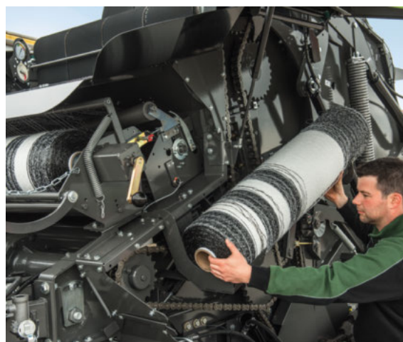
■ Svitek mreže hitro in enostavno namestite na mesto za dodatno zalogo.