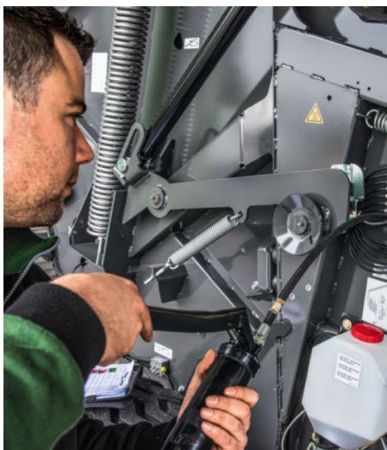
■ S centralnim mazanjem hitro namažete mazalna mesta.

Premišljeno do najmanjših podrobnosti, da vse teče.